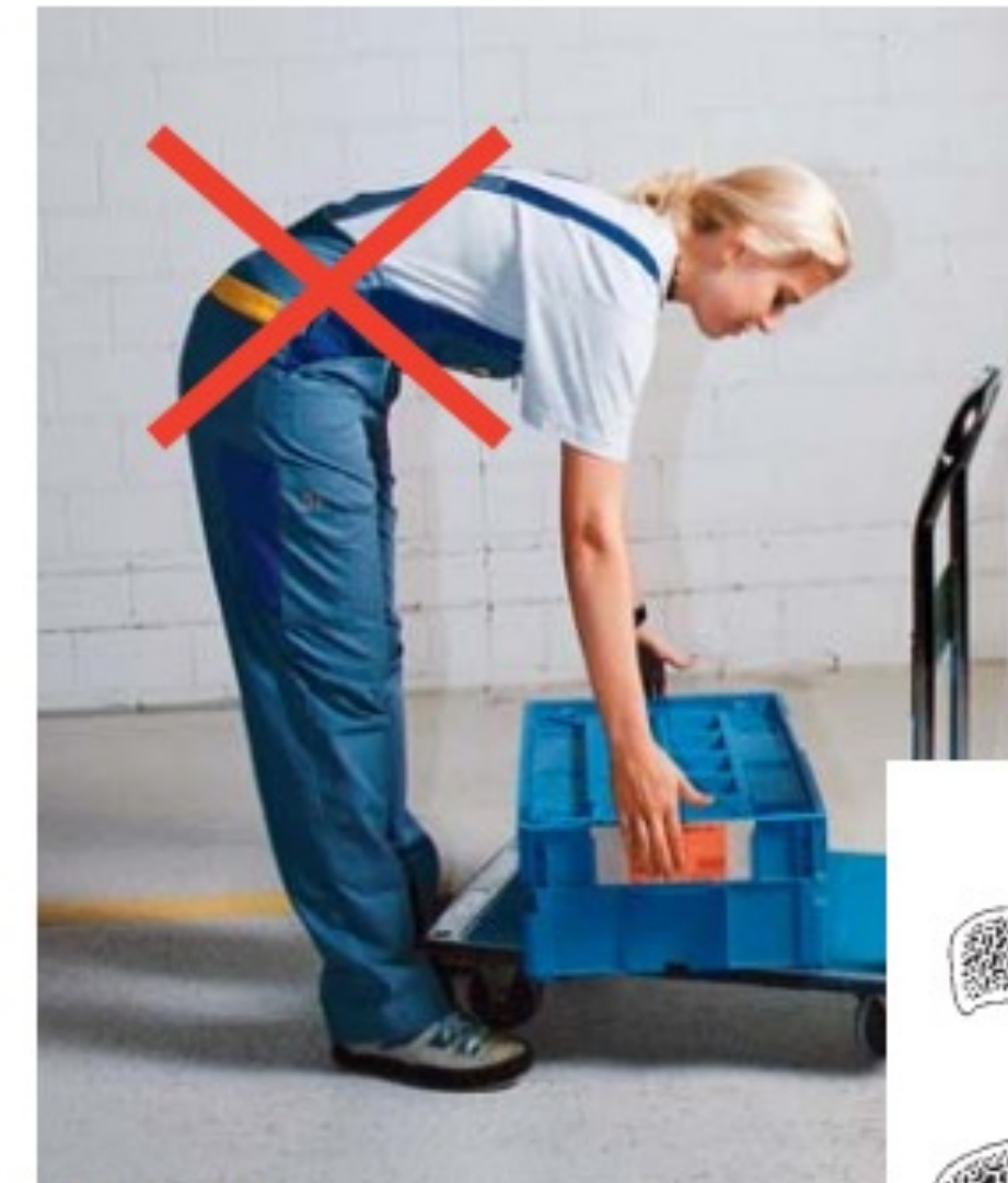
Illustration 3 Soulever une charge avec le dos courbé (mauvaise posture).