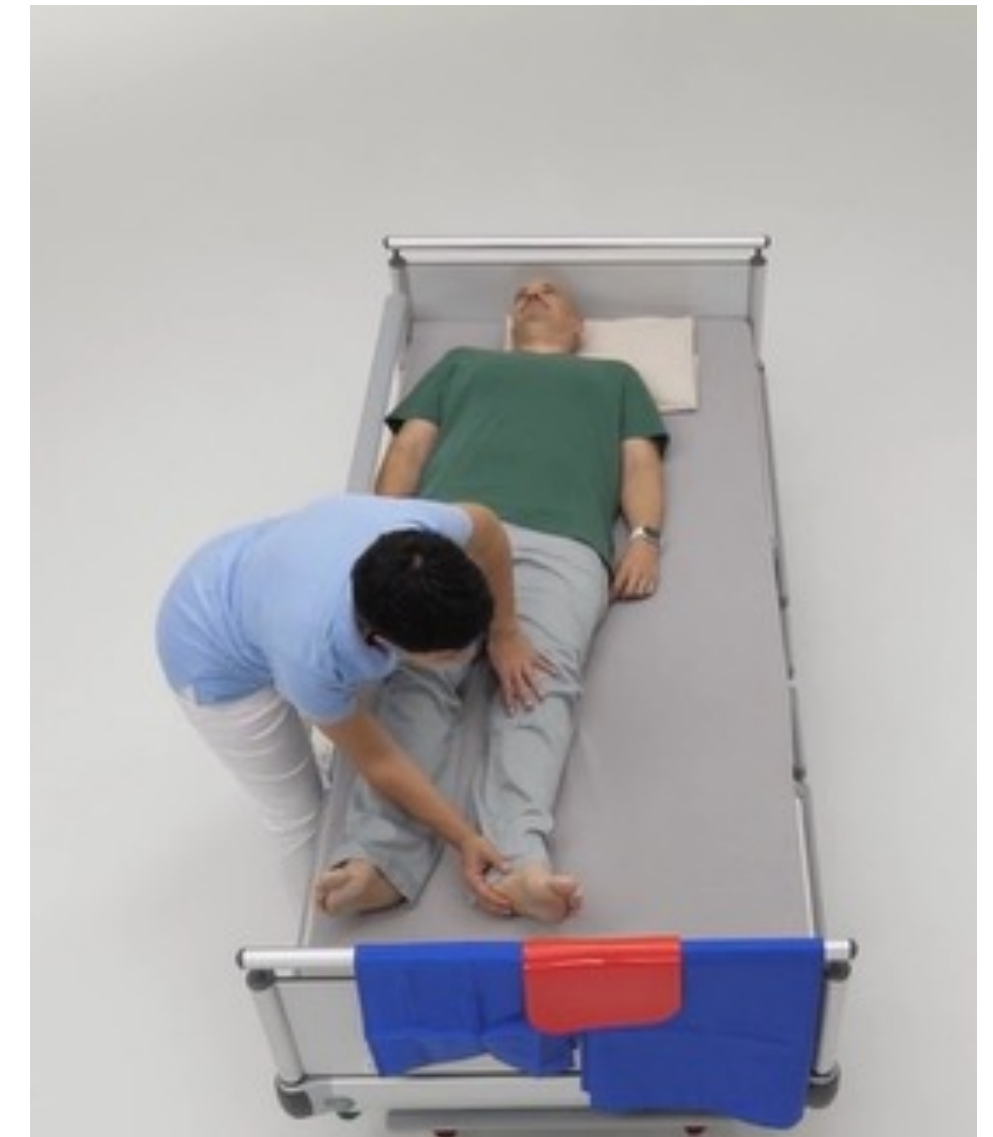
transfert intelligent